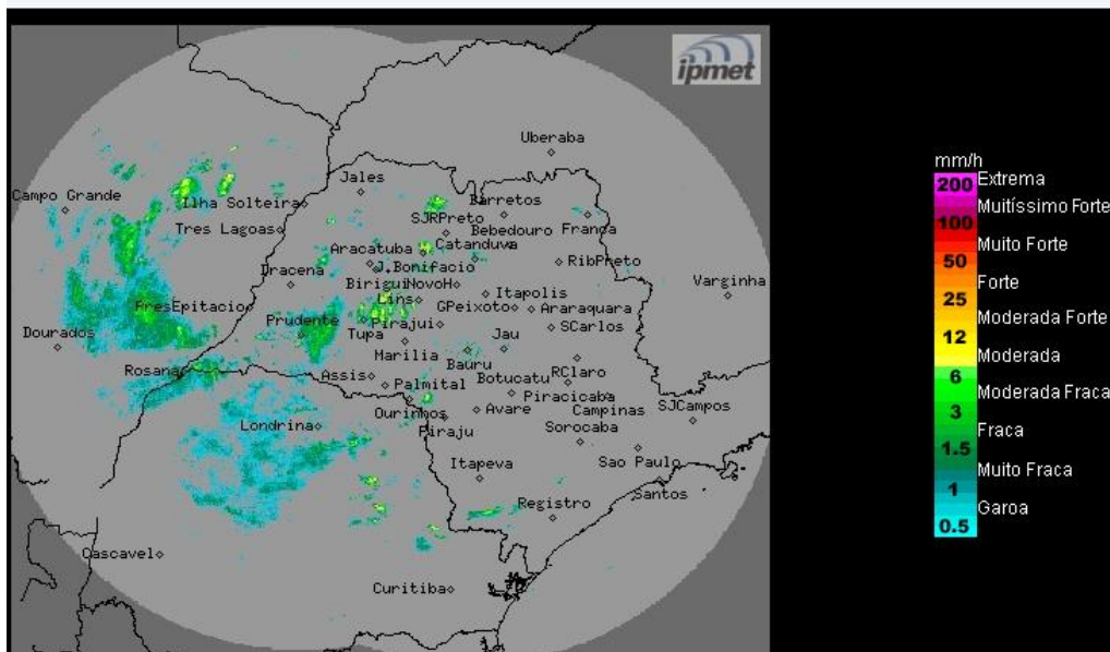
Imagem Composta dos Radares de Bauru e de Presidente Prudente - 10/10/2018 13:45

Os radares meteorológicos do IPMet/UNESP, instalados em Bauru e Presidente Prudente, estão detectando chuva forte, acompanhada por descargas elétricas, no oeste do estado de São Paulo. No momento chove nos municípios de Presidente Prudente, Dracena, Santo expedito, Adamantina, Caiuá, Irapuru e Guaraçai.